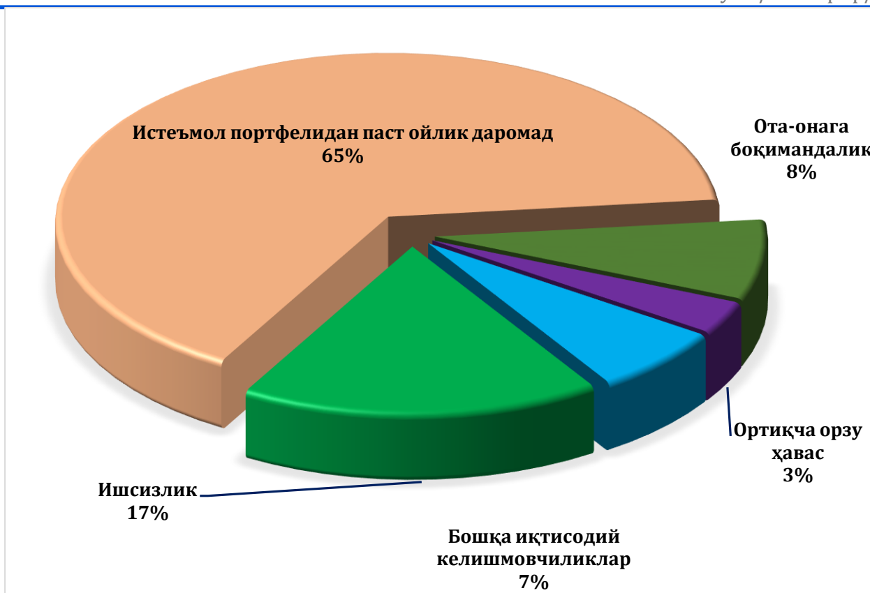
1-расм. Тошкент шаҳрида оилалардаги иқтисодий қийинчиликлар таъсирида ажралишларнинг асосий кўрсаткичлари, 2024 й.

Расм маълумотлари шуни кўрсатадики, оилада ишсизлик (айниқса эрнинг), ота-онага боқимандалик, яъни ҳали бирор касб эгаси бўлмаса-да ота-она томонидан фарзандларини никоҳлантириб қўйиш ҳам Тошкент шаҳрида айрим оилаларда ажримнинг келиб чиқишига сабаб бўлган.