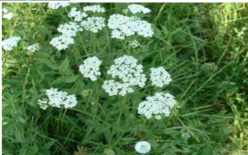
1-rasm. Achillea millefolium L. – Oddiy bo‘ymadaron