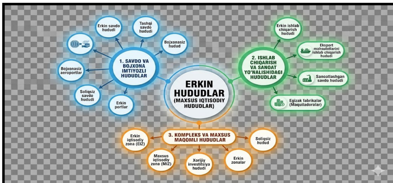
1-rasm. Erkin zonalarining turlari va klaster metodida tasvirlanishi

Yuqoridagi rasmdan ko'rish mumkinki erkin zonalarining 20 dan ortiq turi mavjud. Har bir mamlakatda erkin zonalar tushunchasi turlicha ko'rinishida nomlanadi va tashkil etilgan bo'ladi [5]. O'zbekiston Respublikasida erkin zonalar "erkin iqtisodiy zonalar" tushunchasi orqali amalga oshirilgan. Erkin iqtisodiy zonalar ham o'z navbatida mamlakatimizda agro erkin iqtisodiy zonalar, farmasevtik erkin iqtisodiy zonalar, turistik-rekreatsion erkin iqtisodiy zonalarga ham bo'linadi.