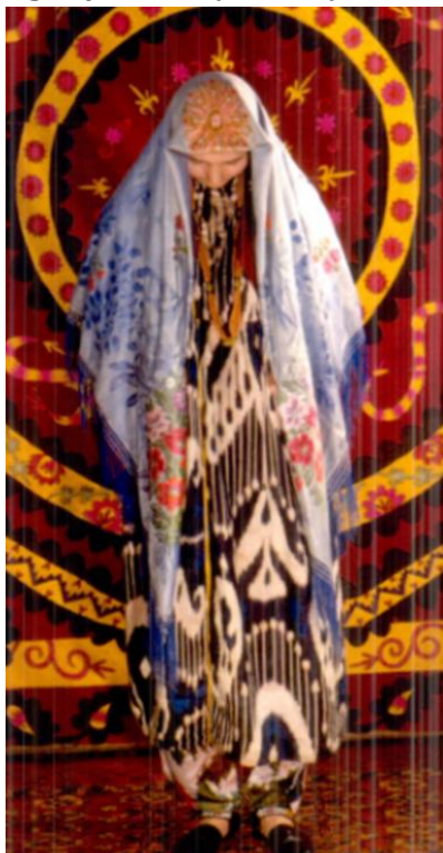
6-rasm. Yangi tushgan kelin libosi. Toshkent. XX asr boshi

yuqori narxi ushbu matolarning asosan to‘y liboslari uchun ishlatilishiga sabab bo‘ldi (6-rasm). Bu davrda ko‘krak qismi burmali ko‘ylaklar nafaqat kelinlar libosida, balki kundalik ayollar kiyimida ham keng tarqaldi. Shuningdek, 1950-yillardan krepdeshin matosining kirib kelishi kelinlik liboslari modasida muhim o‘zgarishlarni yuzaga keltirdi. Mazkur mato tez orada ommalashib, kelinlar orasida keng qo‘llanila boshlandi, atlas ko‘ylaklar esa asta-sekin kundalik kiyim sifatida qaror topdi. 1970-yillardan boshlab esa Toshkent shahrida Yevropa uslubidagi kelinlik liboslari kirib kela boshladi. Xususan, nemis gipyuridan tikilgan oq ko‘ylaklar an’anaviy ko‘p qatlamli liboslar o‘rnini egallab, xalq orasida “fata ko‘ylak” nomi bilan mashhur bo‘ldi. Keyinchalik ushbu uslub respublikaning boshqa hududlariga ham yoyilib, zamonaviy kelinlik modasining muhim tarkibiy qismiga aylandi 17 (7-rasm).