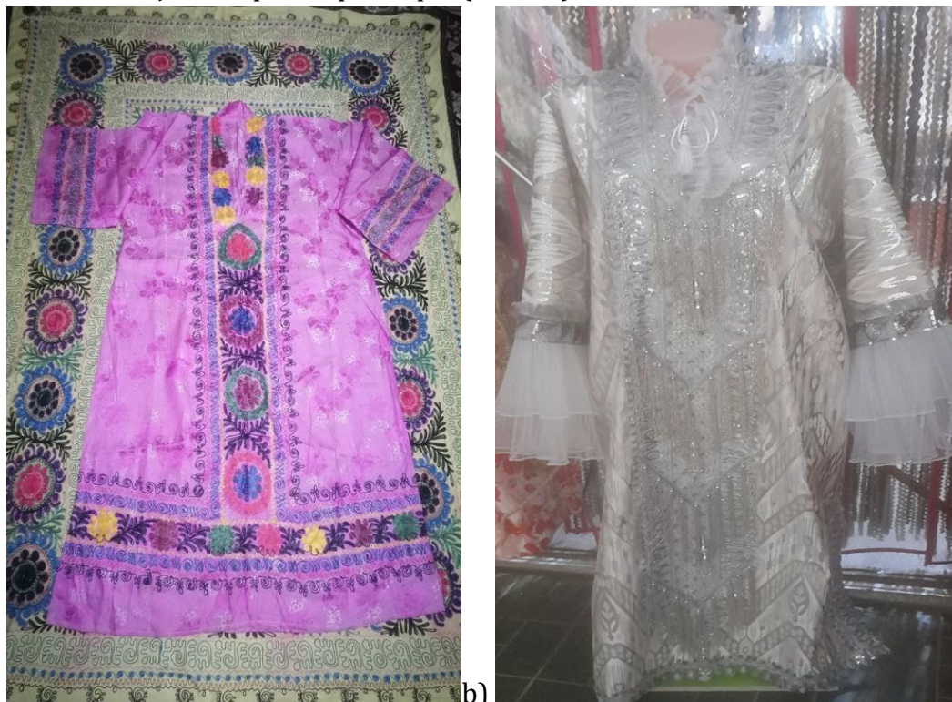
a) 1980-90 yillarga xos kelinlar “kashta ko'ylagi” b) XXI asrning 20-yillariga xos “katta ko'ylak”

tikilgan 16 . Dastlab bunday liboslar uchun shoyi matolar ishlatilgan bo'lsa, 1980-yillardan boshlab parcha matolar ham keng qo'llanila boshlagan. Ranglar asosan to'q qizil va unga yaqin turlarda bo'lib, ular baxt, farovonlik va muhabbat timsoli sifatida talqin etilgan. Bugungi kunda mazkur an'anaviy liboslar tarkibiy jihatdan o'zgarib bormoqda, ammo ular zamonaviy kelin garderobida ma'lum darajada saqlanib qolmoqda (5-rasm).