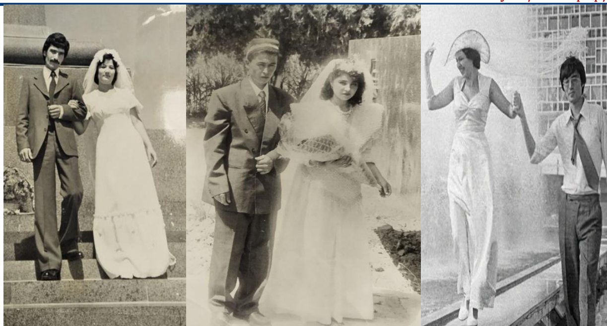
7-rasm. XX asr oxirida ommalashgan “fata ko’ylaklar”

Mustaqillikdan keyingi davr, xususan 2000-yillardan boshlab respublikada bozor iqtisodiyotining shakllanishi, savdo aloqalarining kengayishi hamda import-eksport jarayonlarining faollashuvi to‘qimachilik mahsulotlari assortimentining sezilarli darajada boyishiga olib keldi. Shu bilan birga, mahalliy fabrikalarda mato ishlab chiqarish hajmining ortishi ham ichki bozorda turli xil sifat va tarkibga ega materiallarning paydo bo‘lishini ta’minladi. Natijada kelinlik liboslari uchun tanlanadigan matolar xilma-xilligi kengaydi. An’anaviy atlas, adras va shoyi matolar o‘z mavqeini saqlab qolgan bo‘lsa-da, ular qatorida “qor malikasi”, “gavyota”, “linda”, “sitora” kabi zamonaviy matolar hamda Buxoro zardo‘zlik an’analari asosida ishlangan bezakli matolar keng qo‘llanila boshladi. Shuningdek chevarchilikning yanada rivojlanishi liboslar bichimida turli shakl va uslublarni olib keldi. Shuningdek bozorlarda endilikda fabrika va tekstillarda ishlab chiqarilgan tayyor kelin ko‘ylarining savdosi ham yanada rivojlandi(8-rasm).