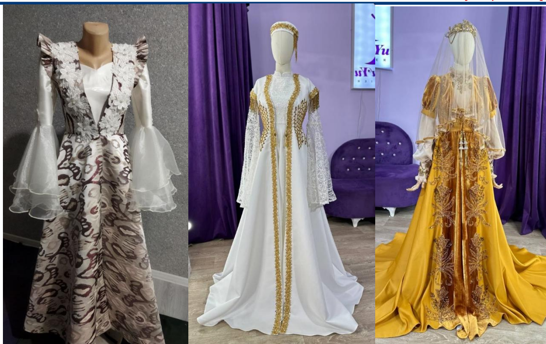
10-rasmlar. 2000-2025-yillar oralig'idagi kelin ko'ylaklari.