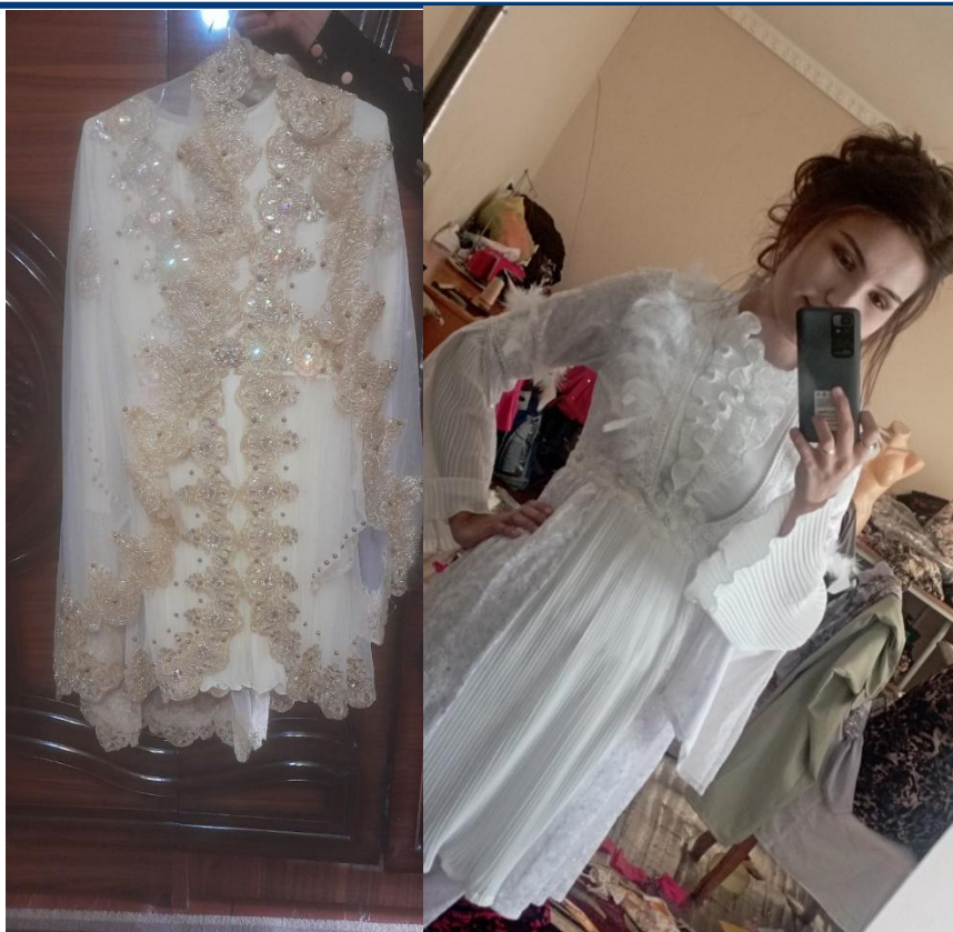
9-rasm. XXI-asrning 20-yillarida kelinlarning an'anaviy “oqlik” ko'ylaklari. Turli xil bichim va uslublarda.