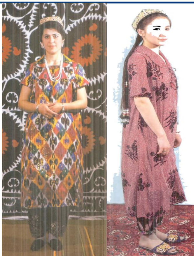
8-rasm. XX asr oxirida kelinlarning kundalik ko‘ylaklari( ko‘krak burma uslubida).

2010-yillardan e‘tiboran oq kelinlik ko‘ylaklar uchun sun‘iy tolalardan tayyorlangan, xalq orasida “lazer” nomi bilan tanilgan matolar ommalashdi. Ushbu materialning yaltiroq va silliq tuzilishi uni nafaqat asosiy ko‘ylak, balki boshqa liboslarning ichki qismi sifatida ham qo‘llash imkonini berdi. Mazkur davrda kelinlik liboslari bichimi va yoqa shakllarida qat‘iy an‘anaviy me‘yorlarning susaygani kuzatilib, individual did, moda tendensiyalari va chevarlarning ijodiy yondashuvi ustuvor ahamiyat kasb eta boshladi. 2015-yillardan boshlab “pombah” matosining keng qo‘llanilishi kelinlik oq ko‘ylaklarning funksional o‘zgarishiga sabab bo‘ldi. Avval ichki qatlam sifatida kiyilgan oq ko‘ylak endilikda mustaqil libosga aylanishi bilan uning ijtimoiy va estetik vazifasi kengaydi. Mazkur matolarning mavsumiy — qalin va yupqa turlari mavjud bo‘lib, ular iqlim sharoiti va iste‘molchilarning ehtiyojiga mos ravishda tanlanadi(9-rasm).