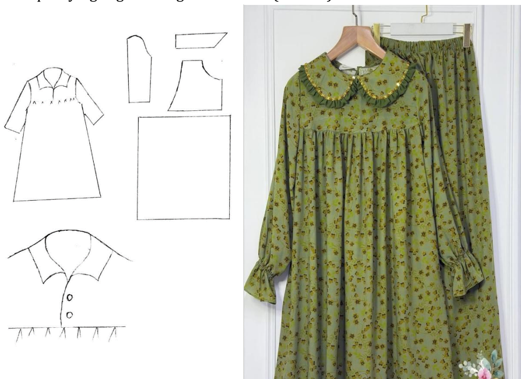
3-rasm. Ko‘krak burma ko‘ylak tuzilishi.

1930-yillardan boshlab dastlab Toshkent shahrida, keyinchalik esa boshqa hududlarda ham ayollar liboslarida sezilarli o‘zgarishlar kuzatila boshladi. Xususan, to‘y va kundalik ko‘ylaklar bichimida yangicha uslub – ko‘krak qismi burmali shaklda ishlangan bichim-uslubning ommalashuvi yuz berdi. Mazkur ko‘ylak turi qisqa vaqt ichida ayollar va qizlar orasida keng tarqaldi. Uning bichim xususiyatlariga e‘tibor qaratilsa, yuqori — koketka qismi gavdaga mos qilib tikilganbo‘ladi, pastki qismi kengaytirilgan holda serburma qilib ulanadi. Ushbu ko‘ylakning umumiy tuzilishi ham to‘g‘ri tunika shaklda bo‘lib, o‘tirib turish va harakat qulayligini ta‘minlagan 10 . Shuningdek, ushbu bichim funksional jihatdan ham qulay hisoblanadi: u gavdada yaxshi o‘tiradi, tanani siqmaydi va havo aylanishiga imkon beradi. Shu sababli, bu turdagi ko‘ylaklar uzoq vaqt davomida o‘z ahamiyatini yo‘qotmagan. Hozirgi kunda ham uning elementlari zamonaviy talqinlarda uchrab, ayniqsa kelinlarning kundalik liboslarida faol qo‘llanilmoqda. Bu esa mazkur bichimning nafaqat tarixiy, balki amaliy va estetik jihatdan ham barqaror qadriyatga ega ekanligini ko‘rsatadi(3-rasm).