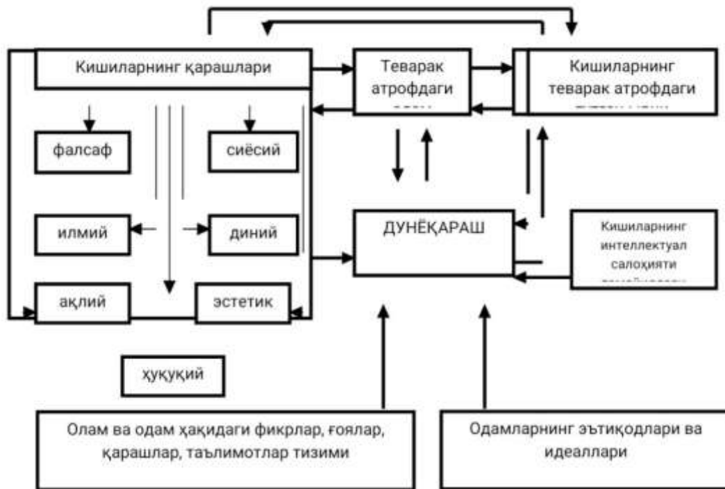
1.1.1.- шакл. Шахс дунёқараши шаклланиш омиллари ва уларнинг ўзаро муносабатлари.

Шахснинг дунёқараши, айниқса, илмий дунёқарашнинг кенглиги уларнинг асосий таркибий қисмлари: ақл, онг, фикр, илм, билим, илмий билим, илмий қараш, эътиқод, илмий тафаккур ва шу кабиларга боғлиқ.