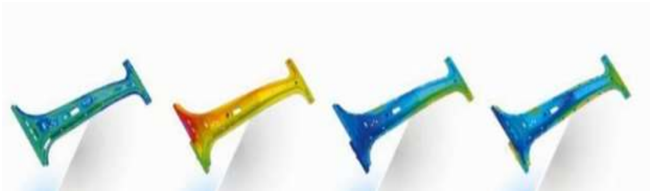
Рис. 3. Измеренная и рассчитанная деформация сборки рамы после соединения контактной стыковой сварке в конструкцию с учетом неточностей допусков двух отдельных формованных компонентов рамы.

таких эффектов вместе с тепловыми эффектами во время сварочных процессов, а также учет остаточных напряжений и деформационного упрочнения материалов конструкций увеличивает сложность целостных вычислительных подходов.