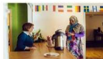
Mission in Ireland