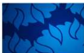
Artwork & Logos

Irlandiya presviterian cherkovi kalendari; ibodat; "Presbyterian Herald" ("Presviterian xabarnomasi") gazetasi; "Presviterian ayollari" klubi; jamoatchilik ishlari; himoya xizmati; ibodat va an'analar; bolalar va yoshlar.