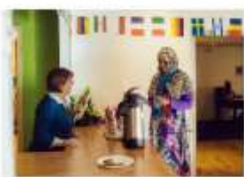
Mission in Ireland