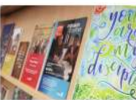
Magazines & Newsletters