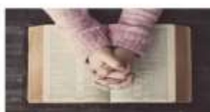
Let's Pray resources