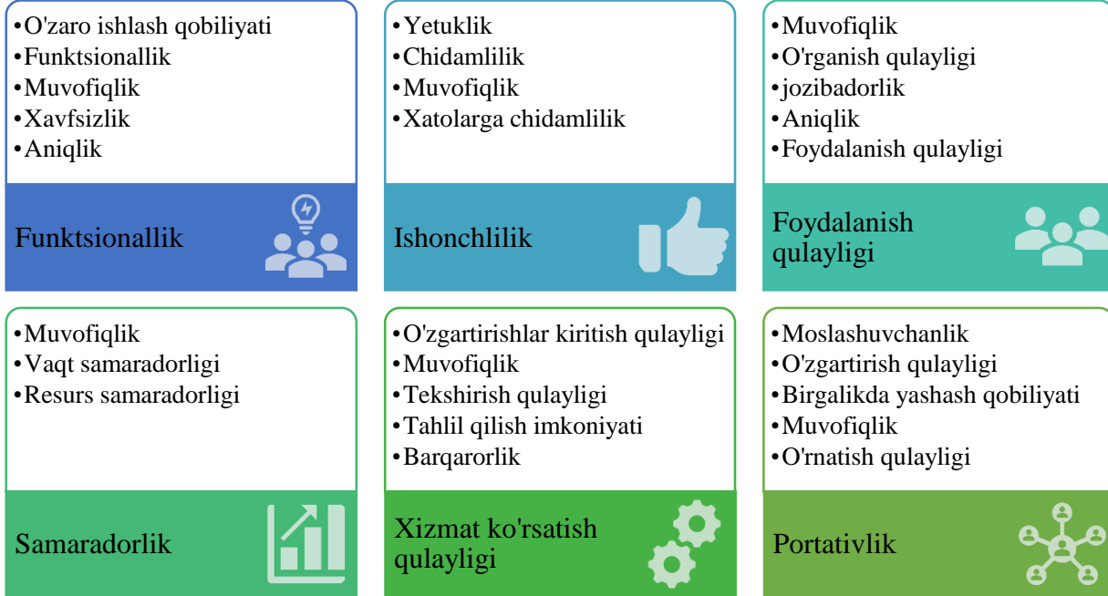
2-rasm. ISO 9126[4] standartida axborot tizimlarining sifat ko'rsatgichlari

tizimining sifatini baholashning xalqaro va milliy standartlari va me'zonlari mavjud. ular tizimning sifatini nazorat qilishda foydalaniladi. ishlatiladigan verifikatsiya va validatsiya mavjud. qo'yilgan maqsadga mosligi, foydalanuvchilarga qulayligini, tizimni yaratishdan manfaatdor tomonlarning talablarini qondirish darajasini hamda xavfsizlik