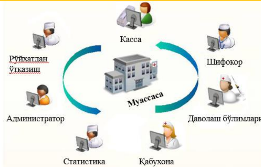
1-Расм. Тизим ишлаш структураси