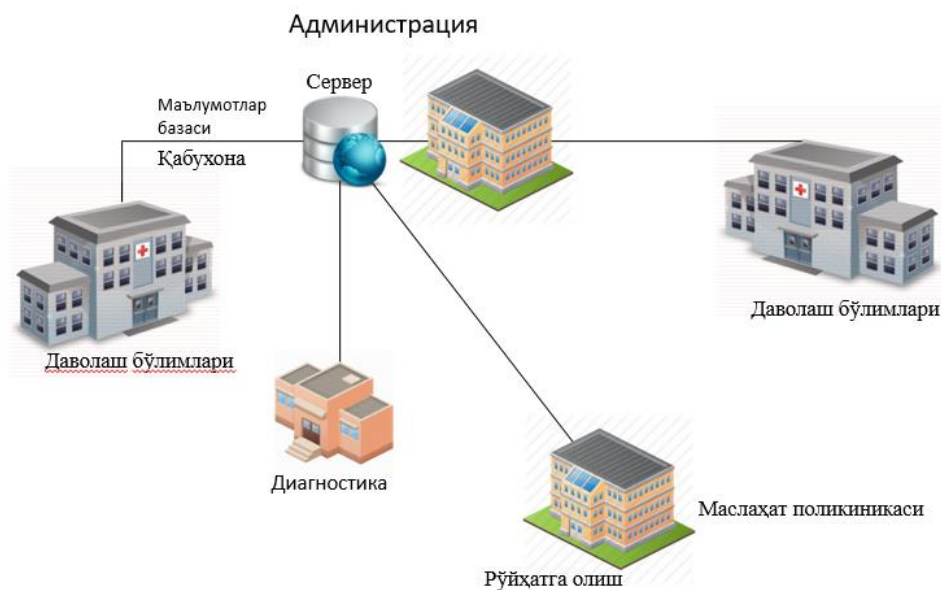
2-Расм. Ҳавфсизлик тизими

Тизим хавфсизлиги таъминлаш мақсадида тизим локал тармоқда ишга тушириш кўзда тутилган. Тизимдаги хар битта фойдаланувчининг ўзига тегишли рўллари мавжуд. Малумотларнинг ким тарафидан нима сабабдан ўзгартирилгани ҳақида администраторга маълумот узатилади. Ташқаридан тизимга рухсатсиз боғланиш имконияти мавжуд эмас. Компьютерлар MAC-Address орқали идентификация