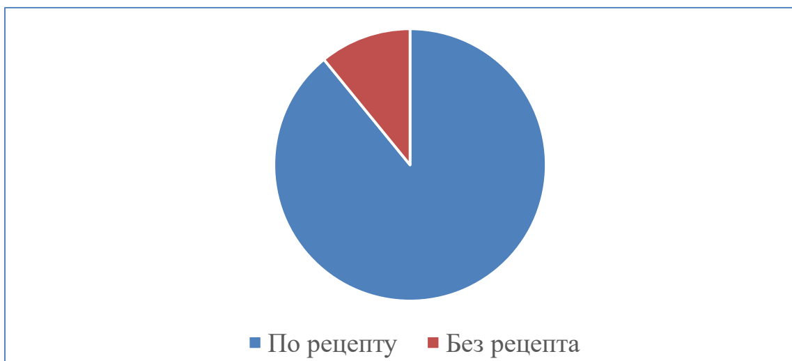
Рис.2. Распределение препаратов по условиям отпуска

Подавляющее большинство препаратов отпускаются по рецепту врача (89,1%).