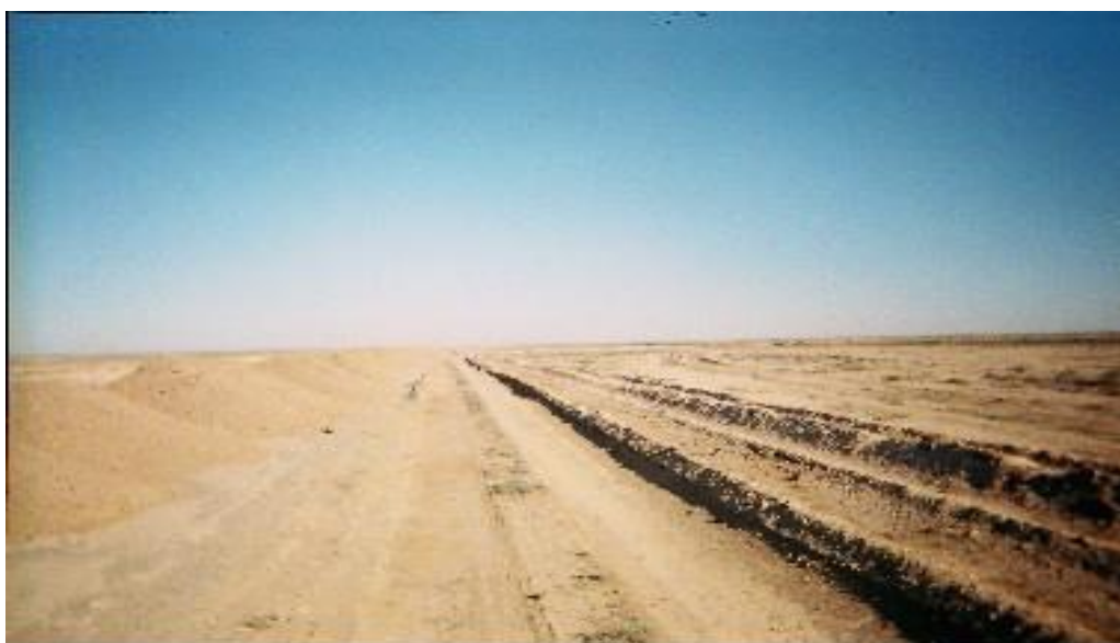
Рис 3. Нарушение структуры почвенного покрова от прокладки автодорог.

используют в поисках нефти газа, подземных вод, строительных материалов, а также при проектировании различных ирригационных сооружений. Антропогенные факторы по своему происхождению разделены на две группы: биогенные и техногенные. Первые включают в себя последствия, вызванные пастбищной дигрессией, вторые – техногенные, вызванные строительством и эксплуатацией мелиоративных систем, распашкой и т.п. Широко масштабные разведочно-поисковые работы привели к увеличению числа паутинообразных дорог, ранее используемых для соединения колодцев. Выявлено негативное влияние пылевых частиц, образующихся за тяжелыми грузовиками, на жизненное состояние растений. Вдоль пыльных дорог на юге Устюрта жизненность доминантных видов низкая, в демографическом спектре отсутствуют молодые особи, проективное покрытие относительно низкое по сравнению с контрольной территорией. По мере удаления от дорог вышеприведенные показатели изменяются в позитивную сторону (рис.3).