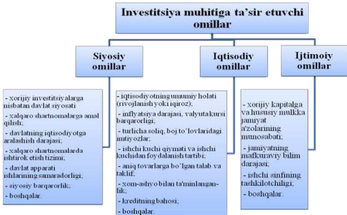
1-rasm. Investitsiya muhitiga ta'sir etuvchi omillar 2

xarakterdagi omillar bilan bog'liq holda shakllanadi. Mamlakat investitsiya muhitini hududiy, mahalliy korxonalar, tarmoq va sektorlar investitsiya muhitiga ajratish mumkin. Shu bilan birga, “mamlakat investitsiya muhiti” bu tushunchalar ichida eng asosiysi hisoblanadi