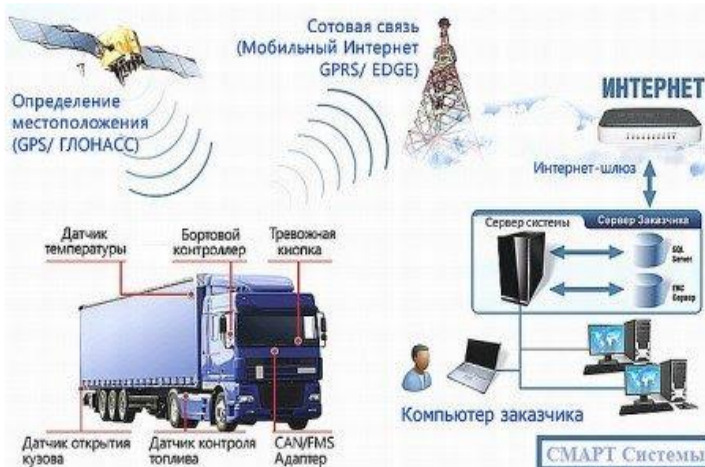
2-rasm. Yuk avtomobillarini GPS/GLONASS orqali monitoring qilish

Navigatsiyani qo'llab-quvvatlash tizimi – bu har qanday ob-havo sharoitida tezkor, yuqori aniqlikdagi, navigatsiya va kartografik-geodeziya vositalaridan foydalanish uchun mo'ljallangan tashkiliy, texnik, dasturiy ta'minot, axborot va texnologik vositalar to'plami hisoblanadi (2-rasm).