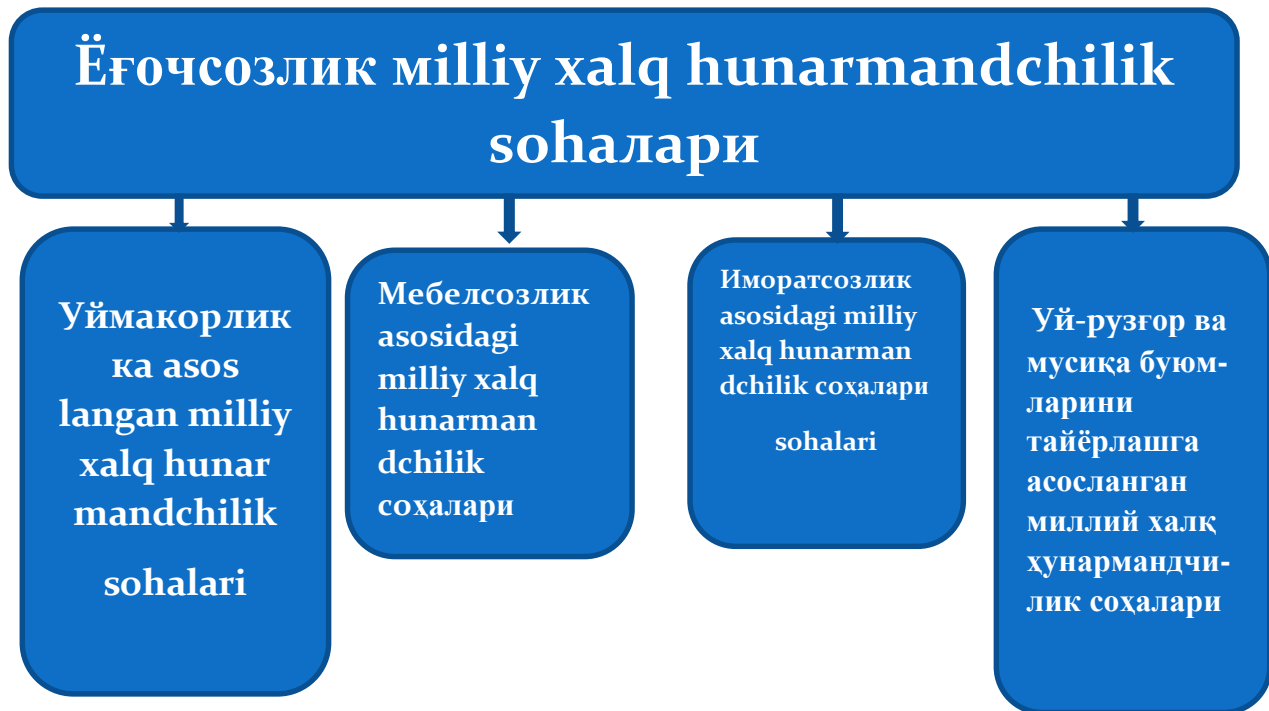
Расм.1.Ёғочсозлик миллий халқ ҳунармандчилик соҳа турлари.

Умумтаълим мактабларида технология таълимини миллий халқ ҳунар-мандчилик бўлимини ўқув дарс материалларини моҳияти буйича ҳунар-мандчиликни вужудга келиш тарихи ва унда тайёрланадиган маҳсулотларини ўрга-тиш материалларига, ҳунармандчиликда ишлатиладиган материалларни ўргатиш материалларга, ҳунармандчиликда ишлатиладиган асбоб ускуна ва жиҳоз мосламалар ҳақида ўргатиш материалларга, ва ниҳоят ҳунармандчи-ликда маҳсулот яратишнинг технологик усулларини ўргатиш материаллари-га булишимиз мумкин(расм- 1 ва 2).