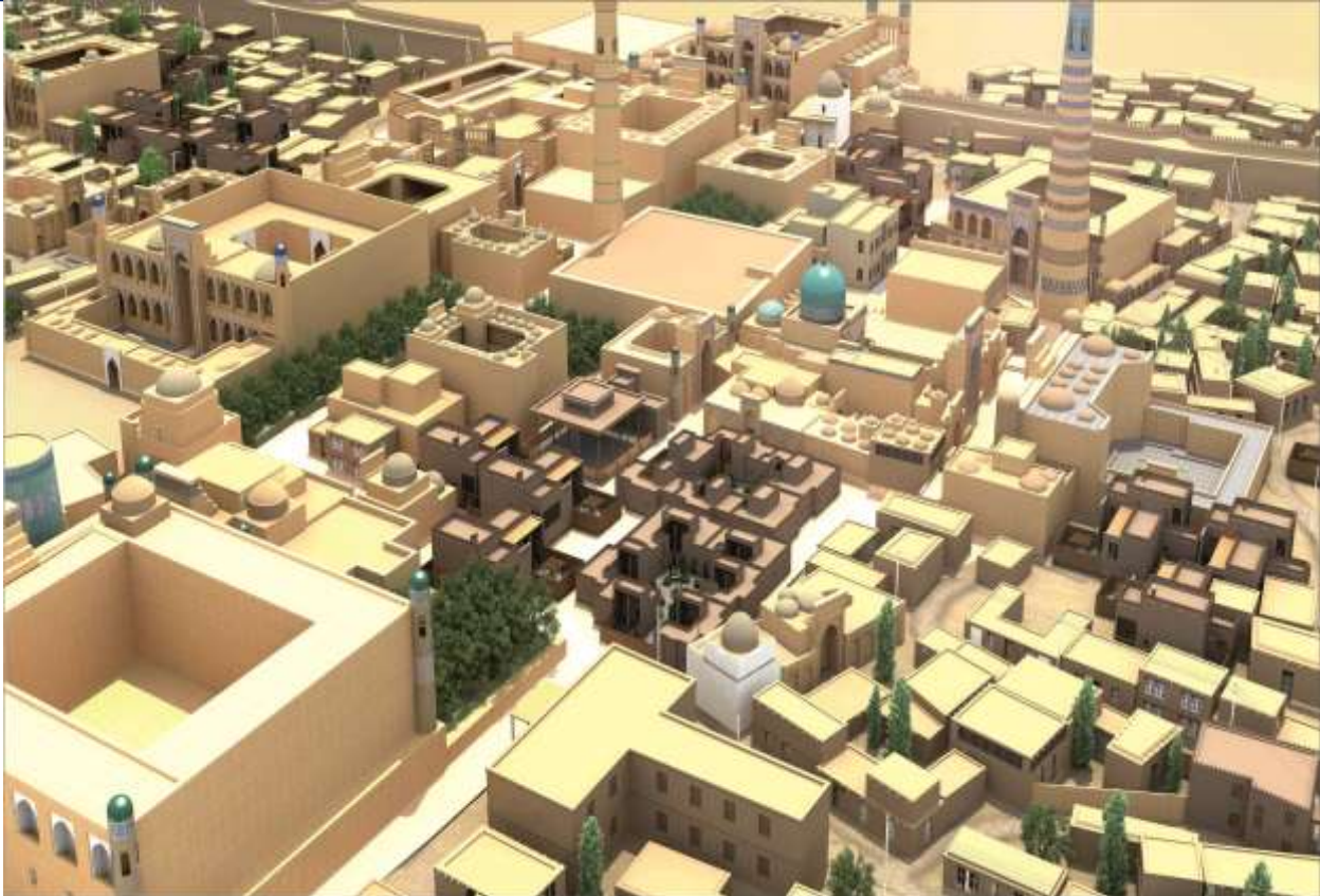
2-Rasm. Ichan-qa'aning bosh loyihasi, UzNIIP Liti loyihasi.

Yegri chiziqli boshi berk ko'chalar, ularning shahar maydonlari bilan aloqasi, masshtab va mutanosiblik, markazning shahar o'zagiga qaratilgan yo'nalishi – bular mintaqaviy shaharsozlikning o'ziga xos xususiyatlaridir.