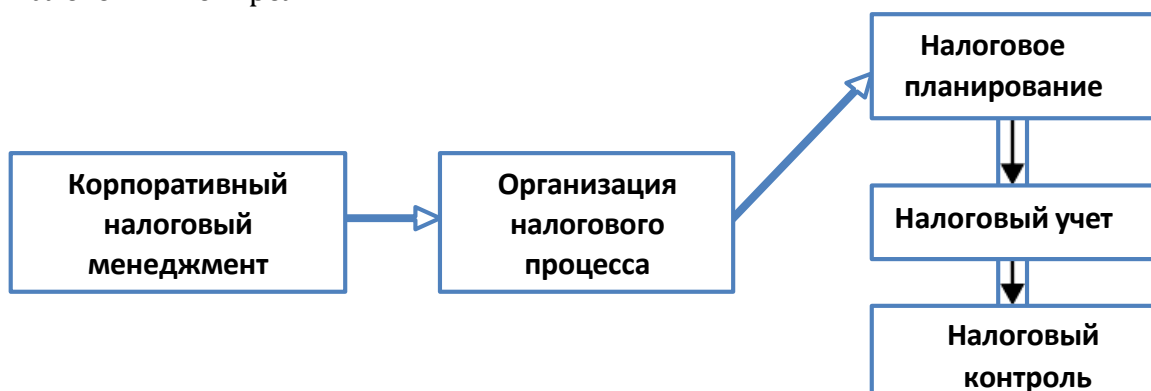
Рис. 1. Структура корпоративного налогового менеджмента. 2

Внедрение налогового процесса на предприятии требует вовлечения