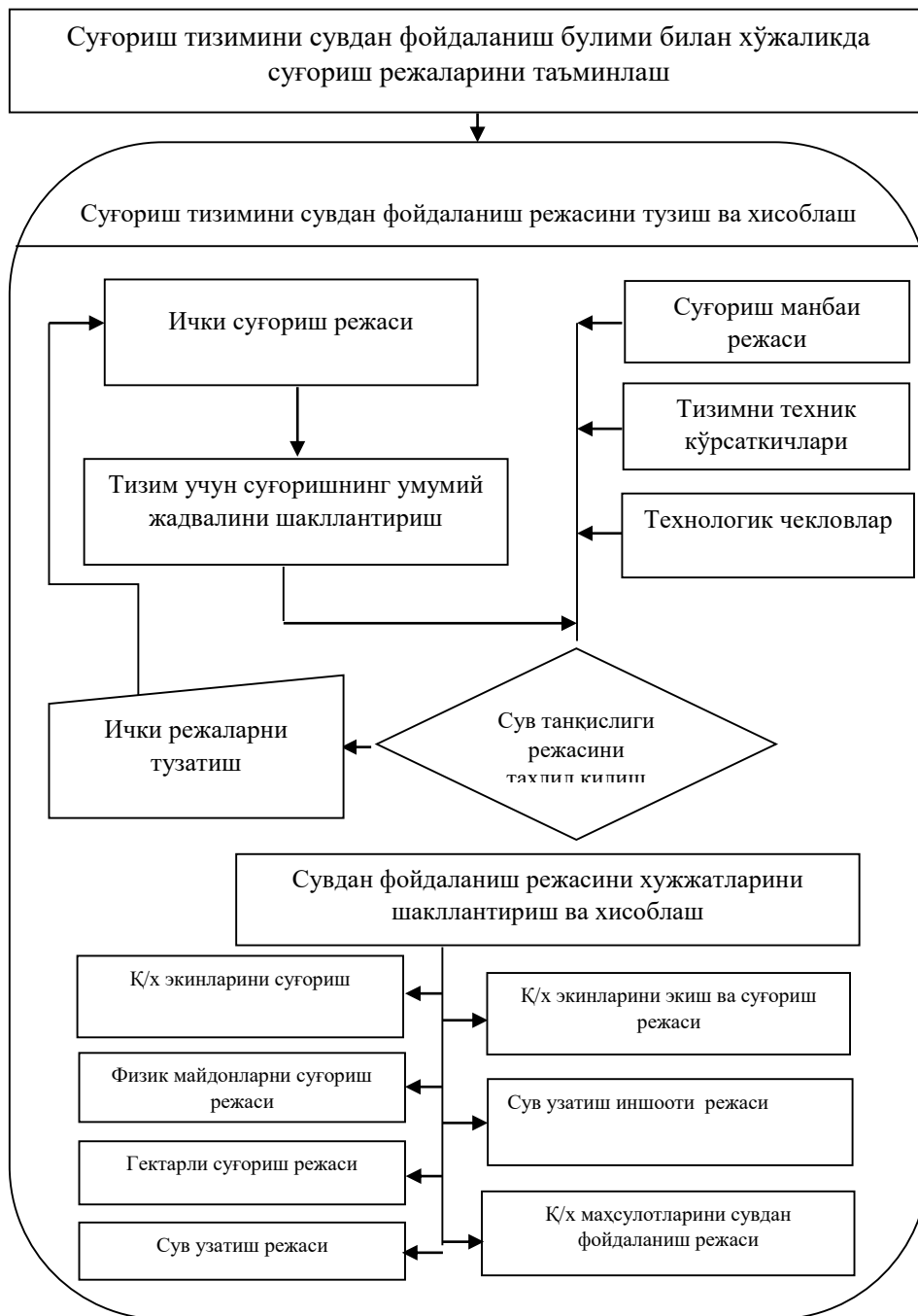
1-расм. Сувдан самарали фойдаланиш ахборот тизимини таркибий тузилмаси

Суғориладиган ерларда экинлар структураси ҳақидаги дастлабки маълумот сув бўлиш нуқталарини кўрсатган ҳолда хар бир сувдан фойдаланувчилар учун алоҳида киритилади.