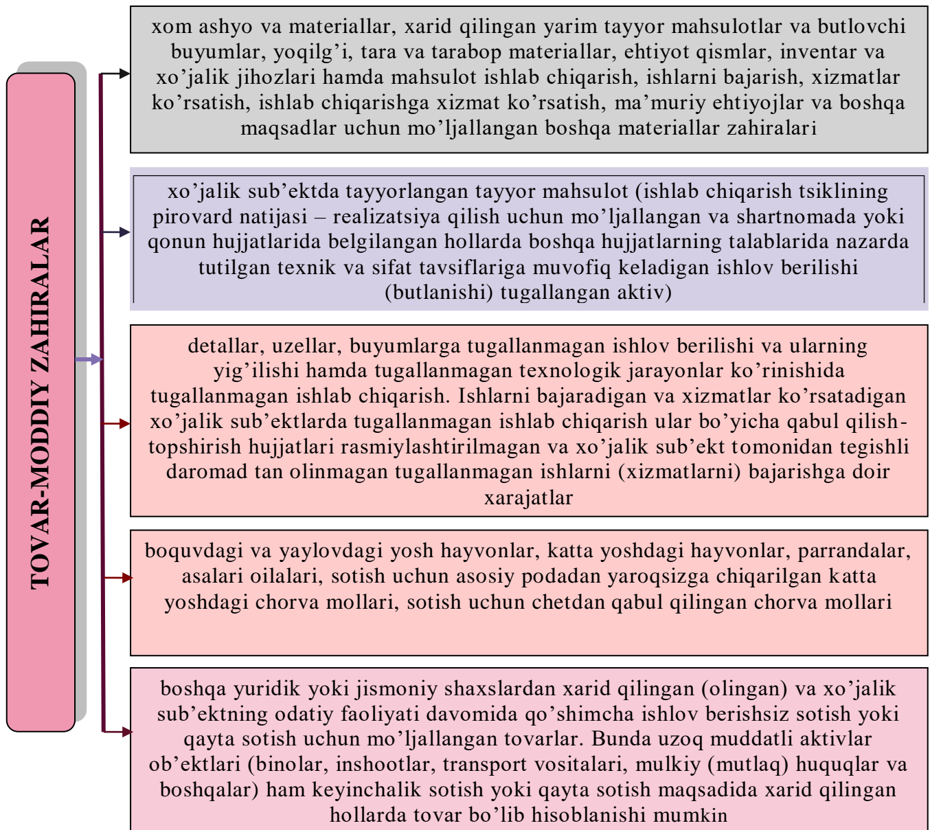
1-rasm. Tovar-moddiy zahiralari tarkibi[1].

• boquvdagi va yaylovdagi yosh hayvonlar, katta yoshdagi hayvonlar, parrandalar, asalari oilalari, sotish uchun asosiy podadan yaroqsizga chiqarilgan katta yoshdagi chorva mollari, sotish uchun chetdan qabul qilingan chorva mollari;