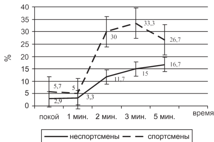
Рис. 1. Динамика изменения диапазона метеочувствительности при нагрузочном тестировании юных спортсменов

Исходя из изложенного, нам представилось актуальным изучение характера влияний комбинации погодных факторов и отдельных метеорологических элементов в условиях умеренной физической нагрузки на функциональное состояние организма юных спортсменов в рамках реакции сердечно-сосудистой системы для возможного прогнозирования их резервных возможностей. В задачи исследования вошли: