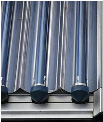
Shakl 2. Vakuum quvurlari.

Shisha vakuumli naychali vakuumli quyosh kollektorlari. Ular termal quvurlardan iborat bo'lib, ular tarkibida termosga o'xshash, ammo trubaning shaffof tashqi qismi bilan. Quvurning ichki qismi quyosh nurini yutadigan maxsus moddalar bilan qoplangan. Bundan tashqari, quvurlar issiqlik o'tkazuvchisi sifatida xizmat qilishi mumkin. Pastki qismdagi bunday quvurlar suvni isitadi va bug'ga aylanadi. Vakuum kollektorlari suvni 250-300 darajaga (cheklangan issiqlik tanlovi bilan) va salbiy atrof-muhit haroratida qaynash nuqtasiga qadar qizdirishi mumkin.