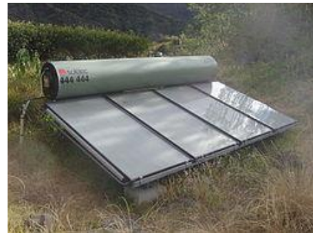
Shakl 4. Passiv suv isitgichi.

Quyosh suv isitgichlari faol yoki passiv bo'lishi mumkin. Faol tizim manifold orqali suyuqlik aylanishi uchun elektr nasosdan foydalanadi; passiv tizimda nasos yo'q va faqat tabiiy aylanishga tayanadi. Sovutgichning quyilishi quyoshdan energiya oladigan Stirling pompasi tomonidan amalga oshiriladigan eksperimental namunalar mavjud.