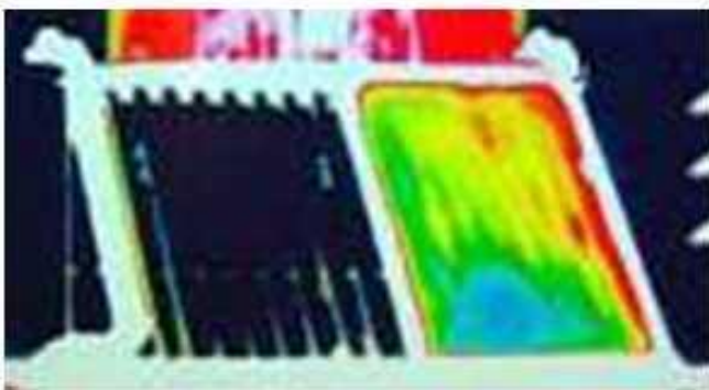
Shakl 3. Vakuum (chapda) va tekis (o'ngda) kollektorlarning issiqlik yo'qotishdagi farq.

fotosuratda vakuum (chapda) va tekis (o'ngda) kollektorlarning issiqlik yo'qotishlaridagi farqni ko'rishingiz mumkin.