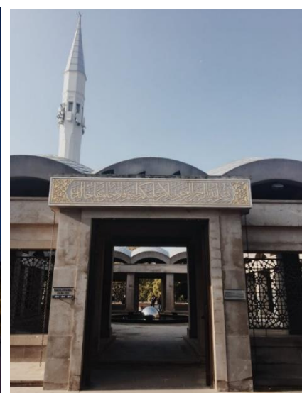
1-расм. Стамбул шаҳридаги Шакирин масжиди.