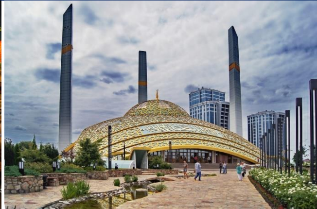
2- расм. Чеченистоннинг Аргун шаҳридаги Аймон Қодирова номидаги замонавий масжид

Ибодат бинолари архитектураси бу меъморий дизайннинг динамик ва хилма-хил соҳаси бўлиб қолмоқда, чунки Ислом диний бинолари шаклларининг ривожланиш жараёни ҳам узлуксиз ва хилма-хилдир. Масжид меъморчилигининг истиқболдаги ҳолати, бир томондан, унинг тарихий ўтмиши билан боғлиқ бўлса, бошқа томондан замонавий қурилишни прогноз қилиш, жамият ривожланишининг ижтимоий-иқтисодий шароитлари ва илмий изланишлар натижаларини ҳисобга олган ҳолда технологик тараққиёт тарзида асосланиши керак. Ҳар бир тарихий давр ва минтақавий эстетик маданият ўзига хос стандартларни таклиф этади. Ва охир оқибатда, дунё масжидлари архитектураси ҳам бошқа жамоат бинолари каби ушбу стандарт анъаналар, урф-одатлар, жамоатчилик фикри, илмий-техник инновациялар ва меъморий стандартлар билан белгиланади.