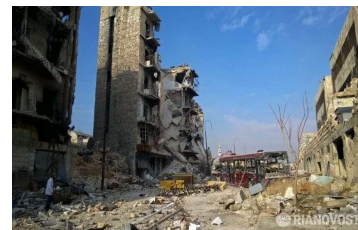
расм. Уюм деворлари ва вайрон қилинган машиналар.

Тўсиқларнинг самарадорлиги кўп жиҳатдан уларнинг бошқа мудофаа элементлари билан бирлаштиришга боғлиқ.