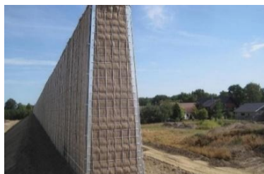
4-расм. Махсус тайёрланган деворлар.

мобил захиралар - ёриб ўтишларга қарши тезкорлик билан ҳаракатланиш учун.