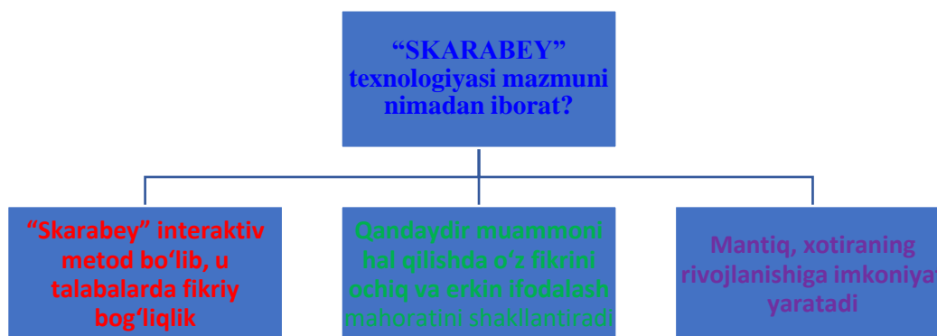
1-rasm. “Skarabey” texnologiya modeli berilgan

Zanjirlash (muayyan tartib) – ahamiyati, muhimligi, mazmuni darajasiga qarab tartiblash.(2-rasm)