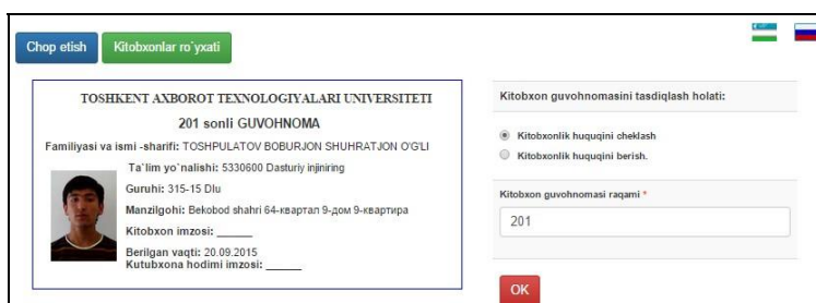
5-rasm. Kitobxonlik guvohnomasini tasdiqlash

Bu sahifada kitobxon guvohnomasini tasdiqlash va chop etish imkoni mavjud. Kitobxonlik guvohnomasini to‘g‘riligi tasdiqlangandan (6-rasm) keyin, talabada OTM binosida joylashgan hamma kutubxona bo‘limlaridan foydalanish huquqi mavjud bo‘ladi.