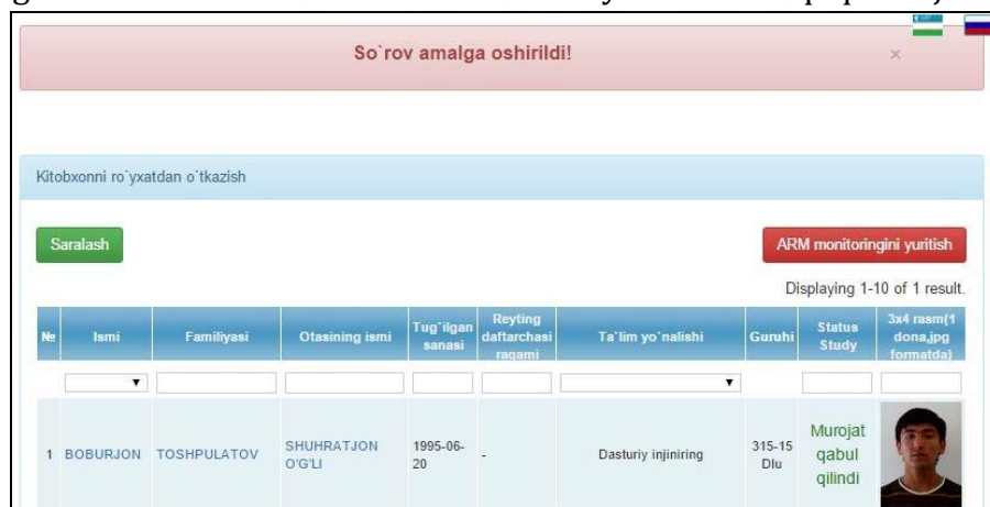
6-rasm. Kitobxonlik guvohnomasini tasdiqlangan xolati.

Bu sahifada kitobxon guvohnomasini tasdiqlash va chop etish imkoni mavjud. Kitobxonlik guvohnomasini to‘g‘riligi tasdiqlangandan (6-rasm) keyin, talabada OTM binosida joylashgan hamma kutubxona bo‘limlaridan foydalanish huquqi mavjud bo‘ladi.