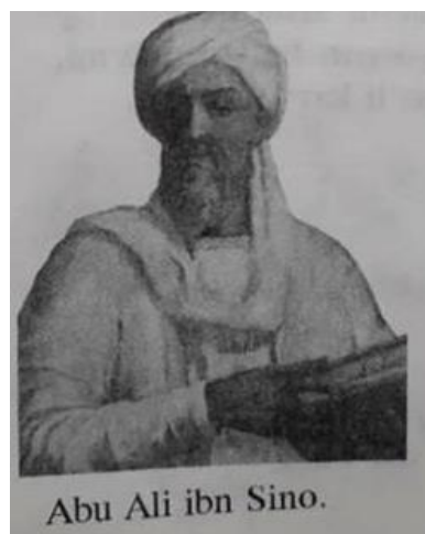
Abu Ali ibn Sino.

shunday deydi: "Bolaning mijozini kuchaytirmoq uchun unga ikki narsani qilmoq kerak. Biri, bolani asta-sekin tebratish, ikkinchisi esa, uni uhlatish uchun aytish odat bo'lib olgan musiqqa va allalashdir. Shu ikkisini qabul qilish miqdoriga qarab bolaning tanasi bilan badan tarbiyaga va ruhi bilan musiqaga bo'lgan is'tedodini xosil qilinadi" .