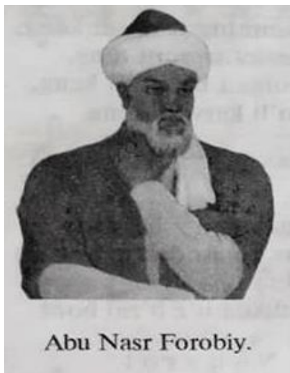
Abu Nasr Forobiy.

ahamiyatli ekan. Chunki, ruhi titik, barkamol kishi o'zida yaxshi insoniy fazilatlarini mujassam eta oladi.