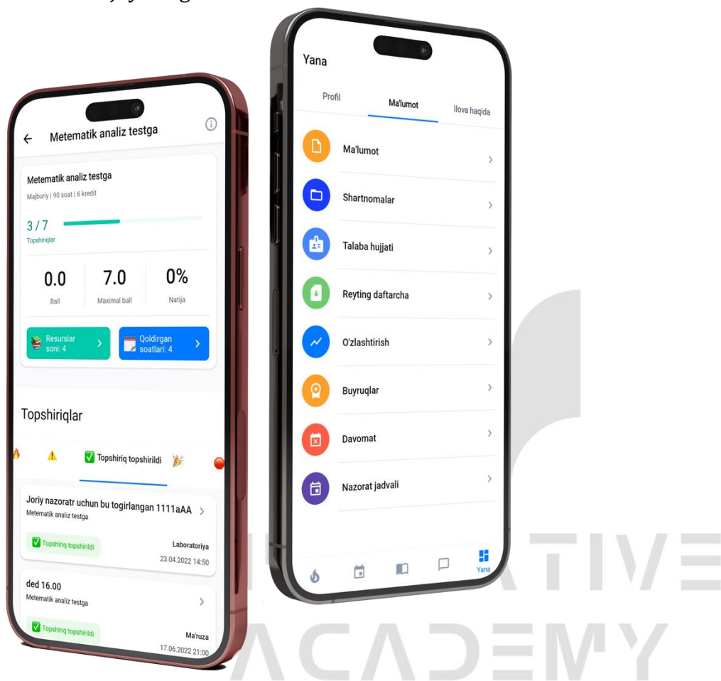
2-rasm. HEMIS Mobile ilovasi

Bu bo'limda talabaning shaxsiy hamda ta'lim ma'lumotlari, shuningdek, mobil ilova sozlamalari joylashgan.