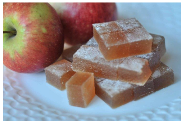
3-расм. қалинроқ ва юмшоқроқ кубчалар

Турли мевалар ва улар аралашмасидан асосан 2 турдаги ширинлик тайёрланди. Биринчиси майин ёйилган лист кўринишида (2-расм). Иккинчиси қалинроқ (2 см) ва юмшоқроқ