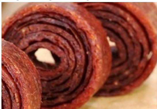
2-расм. Майин ёйилган пастила

кубчалар кўринишида (3-расм). Стевиянинг миқдори 100 г маҳсулотга шакарнинг миқдорига қараб 75 мг гача миқдорни ташкил этди. Бунда маҳсулотнинг таъм хусусиятларига зара етмади. Миқдорнинг меъеридан ошиши эса татиб кўришнинг охирида бир оз тахир таъмнинг сезилишига олиб келди.