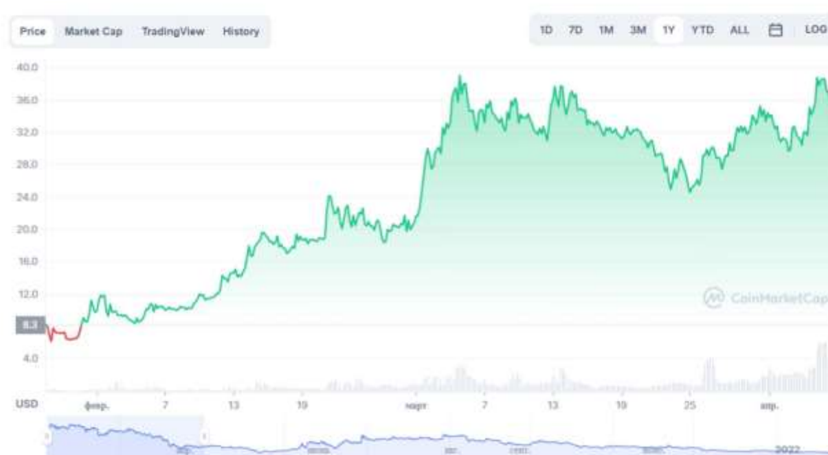
График Flow к USD

Например, сколько можно было зарабатывать? В 2021 году участие в IDO (Initial Dex Offering) 8 приносило по 100, 200 и даже 1000% моментальной прибыли. Например, токен FLOW вырос с $8 почти до $40 — это 500% прибыли за 2 месяца (1 – рисунок 9 ).