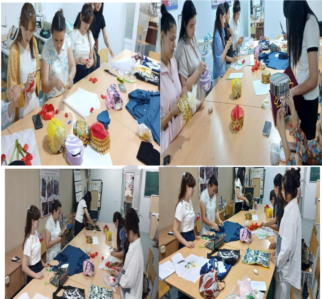
4-rasm. Terdu-Dizayn talabalarining bosh kiyimini tayyorlash jarayoni

kesimida va turli ijodiy to'garaklar asossida do'pchilik namunalari va tikish sizlari muntazam o'rgatilib kelinmoqda.