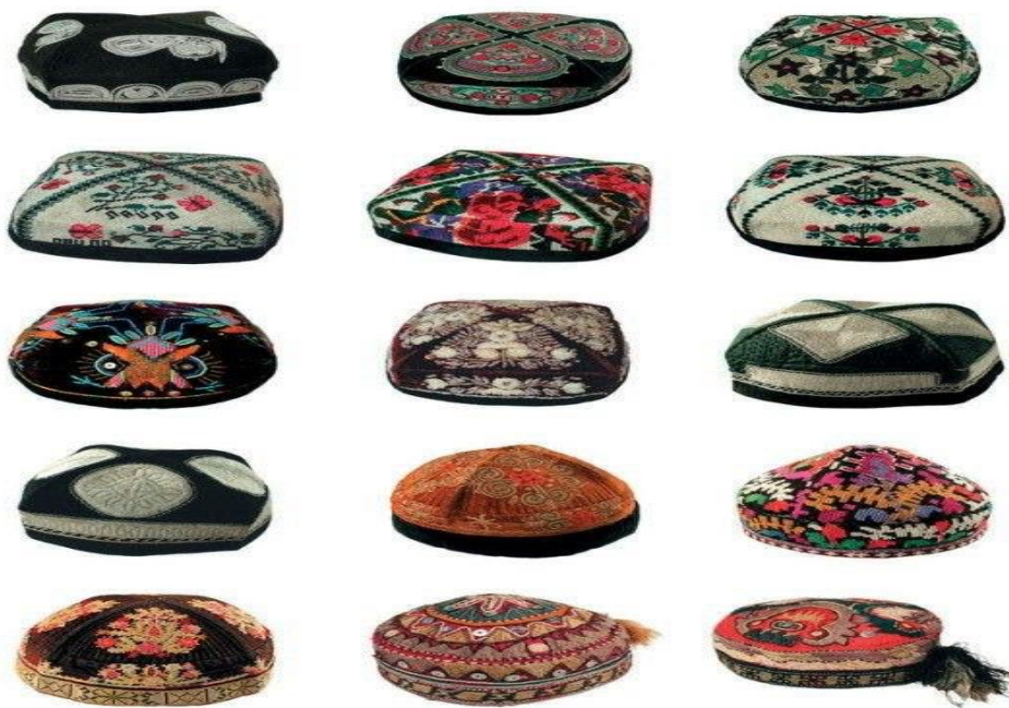
2-rasm. Milliy do'ppi naqshlari va ularning turlari

Bosh kiyimlar asosan kishining bosh va yuz shakliga qarab bugungi kunda tanlanadi va kiyiladi.