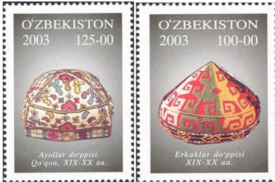
1-rasm.O'zbek milliy do'ppilari