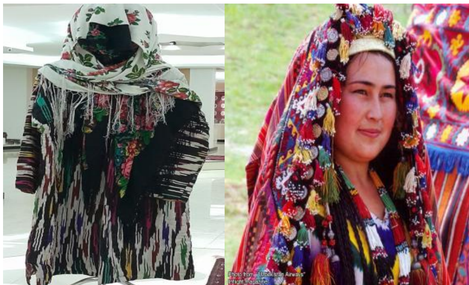
1 - rasm. XIX- XX arsdagi Surxondaryo kashtali ayollar ko'ylagi.

Ayollarning liboslari ichki ko'ylak, ustki ko'ylak, kurta bo'lgan. Bu liboslar havo harorati yuqori bo'lganda ham, yoz mavsumlarida ham ustma – ust kiyilganligini tarixiy manbalardan ko'rish mumkin. Ayollar ichki kiyimi oq surp va oq satindan, ustki libos rangli satindan hamda atlas, ipak shoyi, shoyidan ham tikilgan. Ustidan kiyiladigan jelak va kurtalar yo'l-yo'l alacha matosi hamda beqasam va janda matolaridan tikilgan. Bunday matolar uy sharoitida to'qilgan bo'lib, asosan paxta va jun tolasidan ma'lum miqdorda esa pilladan tayyorlangan. Matolar tabiiy yo'l bilan bo'yalgan. Janda matosi Surxondaryoning Boysun tumanida xunarmandlar tomonidan hozirgacha to'qilib kelmoqda (1- rasm).