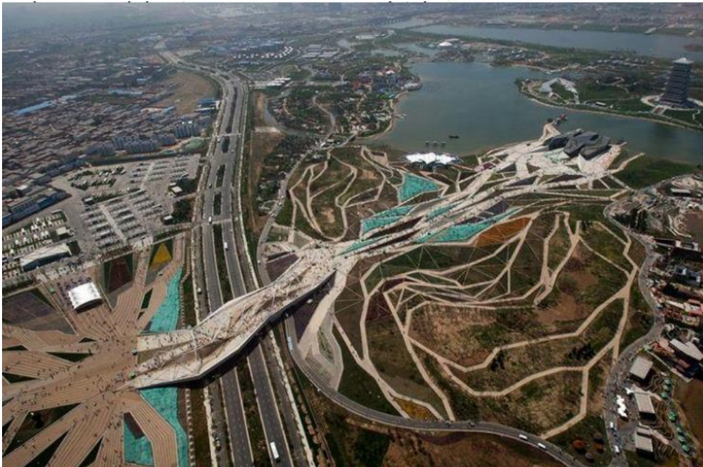
Flowing Gardens, Plasmastudio