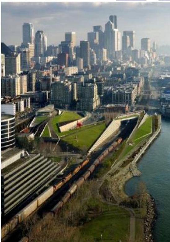
Olympic Sculpture Park, Sietl, AQSh