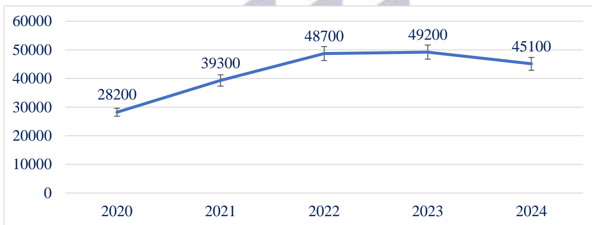
O'zbekistonda oilaviy ajrimlar soni (2020-2024)

Yosh oilalar misolida gender rollarining qayta shakllanishi ayniqsa yaqqol ko'zga tashlanadi. Ko'pgina zamonaviy juftliklar an'anaviy oilaviy modeldan farqli ravishda, "turmush o'rtoq hamkor" tamoyiliga asoslangan tenglikka erishishga intiladilar. Bunday oilalarda qarorlarni er va xotin birgalikda qabul qilishadi, iqtisodiy va maishiy majburiyatlarni ham imkon qadar adolatli taqsimlashga harakat qilishadi. Psixologlar va sotsiologlar bunday yondashuv oilaviy baxtivorlik va barqarorlikni oshirishini ta'kidlashmoqda. Haqiqatan ham, vazifalarning teng bo'lishi, har ikki tomon bir-birining mehnatini qadrlashi nizolarni kamaytirib, oila mustahkamligini ta'minlashga xizmat qiladi.