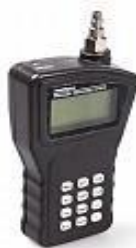
3-rasm. LMP-203 universal elektron bosim o'lchagich

Stroboscopes - bu inyeksion dvigatellarda yonishning elgarilatish burchagini tekshirish uchun asboblar, flesh kechikish sozlamalari bilan jihozlangan stroboskoplardan foydalanish kerak, chunki bu dvigatellarda odatda belgilash uchun alohida belgi yo'q (4-rasm).