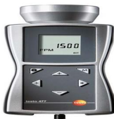
4-rasm. Stroboskop-taxometr Multitronika C2

Stroboscopes - bu inyeksion dvigatellarda yonishning elgarilatish burchagini tekshirish uchun asboblar, flesh kechikish sozlamalari bilan jihozlangan stroboskoplardan foydalanish kerak, chunki bu dvigatellarda odatda belgilash uchun alohida belgi yo'q (4-rasm).