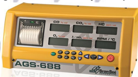
2-rasm. Gaz analizatori 4 - X komponent Gaz analizatorlarining texnik tavsiflari

Gaz analizatorlari - inyeksion dvigatelning chiqindi gazlari tarkibini o'lchash uchun ikki komponentli analizatorlarga nisbatan yuqori o'lchov aniqligi va havo-yonilg'i nisbatini hisoblash bilan 4 komponentli gaz analizatori talab qilinadi (2-rasm va 2-jadval).