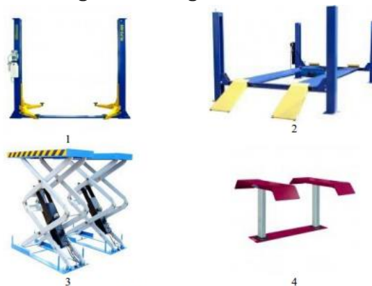
12- rasm-kutargichning asosiy turlari: 1-ikki ustunli; 2-to'rt ustunli; 3-qaychi; 4-porshenli kutargichlarning texnik xususiyatlari

Tanlangan lift 12-rasmda ko'rsatilgan va uning xarakteristikallari 5-jadvalda keltirilgan.