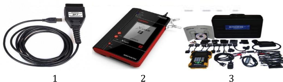
1-rasm. Dvigatellarni boshqarish bloklari va agregatlari skanerlari

Avtomobil turlari bo'yicha qo'llanilishi jadvali va avtomobil tizimlari ro'yxati, har bir avtomobil yoki tizim uchun skanerda amalga oshirilgan funksiyalar to'plami va dasturiy ta'minotni yangilash usuli kabi parametrlar.