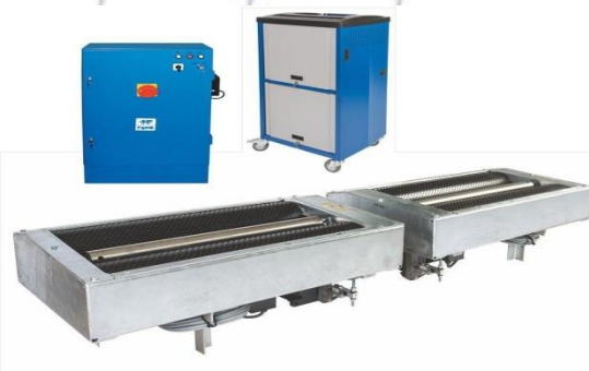
7-rasm. Statsionar universal tormoz sinov qurilmasi STS-10U-SP11 Asosiy xususiyatlari

Diagnostika uskunalarning uchinchi guruhi o'lchaydigan stendlarni o'z ichiga oladi tormozlar Va kuch xususiyatlari mashina (7-rasm va 4-jadval).