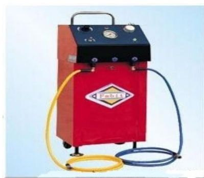
10-rasm-tormoz suyuqligini almashtirish moslamasi 10075