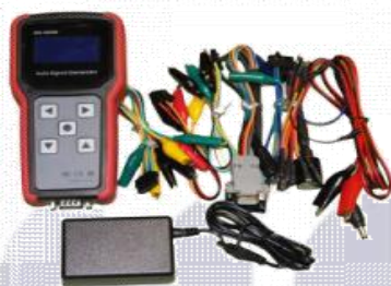
6-rasm. Qurilma uchun signallari datchiklar ADD3058

Ular alohida sensorlar (masalan, harorat sensori yoki gaz holati sensori) signallarining o'zgarishiga qurilmaning javobini tekshirish uchun mo'ljallangan.