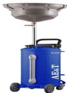
9-rasm.hc-2181 moy yig'ish moslamasi (AE&T)