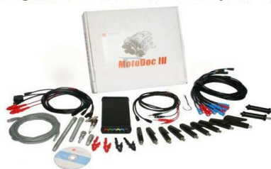
5-rasm. USB Dvigatel sinov qurilmasi MotoDoc 3 motor sinovchilarining texnik xususiyatlari 3-jadval

Dvigatel sinovchilarining farqlari shundaki, u nafaqat ko'rsatishi mumkin har qanday o'lchangan kontaktlarning zanglashiga olib keladigan osilogrammalar, shuningdek murakkab ishlab chiqarish dvigatelning ishlashini bir vaqtning o'zida bir nechta parametrlar bo'yicha baholash (dinamik siqish, tezlashtirish, silindrlarning qiyosiy samaradorligi va boshqalar), bu muammolarni bartaraf etish vaqtini sezilarli darajada kamaytirishga imkon beradi. Dvigatel sinovchilarining ko'rinishi ko'rsatilgan 5- rasm va asosiy texnik xususiyatlar 3-jadvalda.