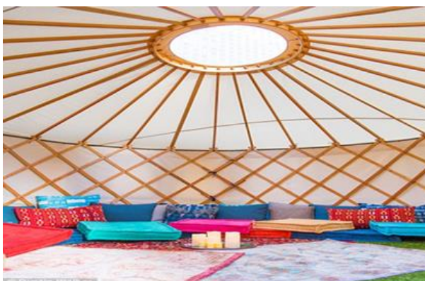
Quyosh panellari orqali yoritiladigan o`tovning ichki ko`rinishi. 3-rasm

Ushbu loyiha afzalliklari va foydali jihatlari quyidagilarda iborat: