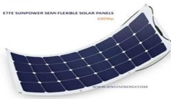
Monokristall quyosh paneli va uning o`tovga qoplanish qismi. 2-rasm

Mazkur sahifada loyihaning 3D ko`rinishi ishlab chiqilgan.