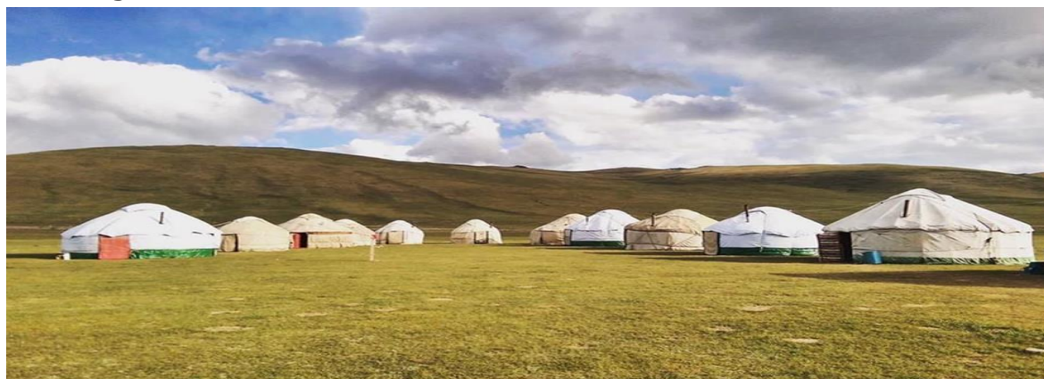
Boysun tumanida joylashtirilgan oddiy o'tovlarning ko'rinishi. 1-rasm.

Yuqoridagi masalalar va muammolarga yechim sifatida o'tov-uylarining tom qismini milliylik va zamonaviylikni uyg'unlashtirgan holda, hozirgi kunda asosiy elektr bilan ta'minlovchi tizim; egiluvchan monokristalli quyosh fotoelektr panellari bilan qoplash yo'li bilan yorug'likdan yig'ilgan energiya orqali, o'tov konstruksiyasini ham yoritish ham microline mato orqali isitish va oziq ovqat mahsulotlarini tayyorlashda yechim sifatida taklif qilinmoqda.